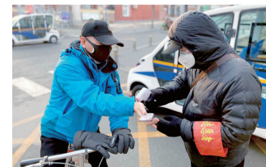
在职党员参与社区值守