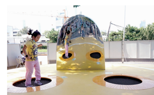
孩子在井点一号玩耍