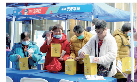
居民在13社区粉丝节上领取礼品