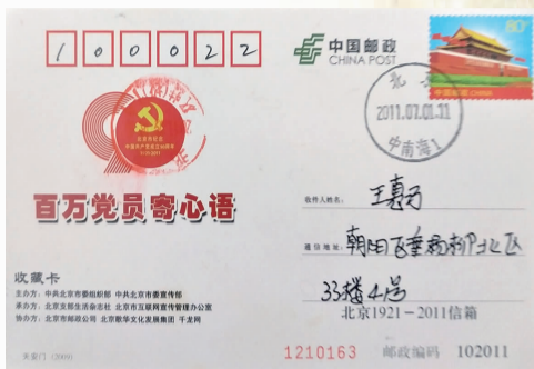
建党90周年百万党员寄心语明信片