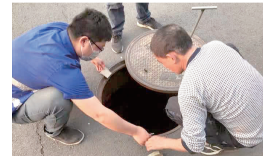
双井街道“接诉即办”修理井盖