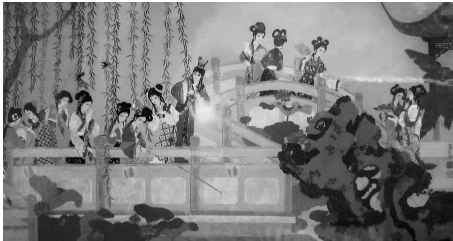
布贴画《金陵十二钗和贾宝玉》