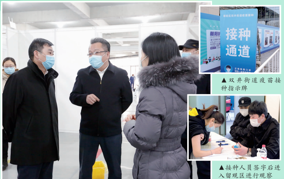
▲领导一行查看疫苗接种点工作情况

新冠疫苗接种工作启动以来,街道积极开展接种点验收工作,同时,相关科室有序部署、广泛宣传,大家同频共振,共同完成新冠疫苗接种工作。在接种点,街道、社区工作人员长期驻点服务,维护现场秩序、信息核验、解答疑惑,做好各项服务保障工作。