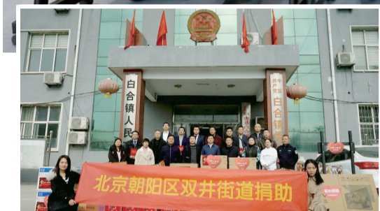
街道将居民、社会单位捐助的物资带到白合镇。