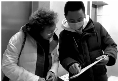
◀社区入户 开展选举动 员工作