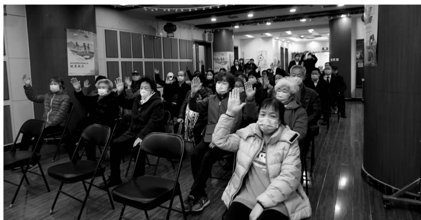
大望社区居民举手表决选举办法

双井各社区居民委员会换届选举将在4月中下旬召开，请广大社区居民踊跃参与，行使您的权利，共同打造、共商、共治、共享的和谐家园。