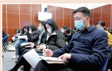
与会人员进行民主测评