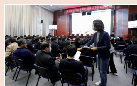
工作人员向与会人员发放测评表