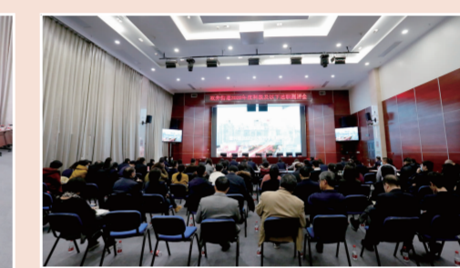
街道全体公务员参加会议