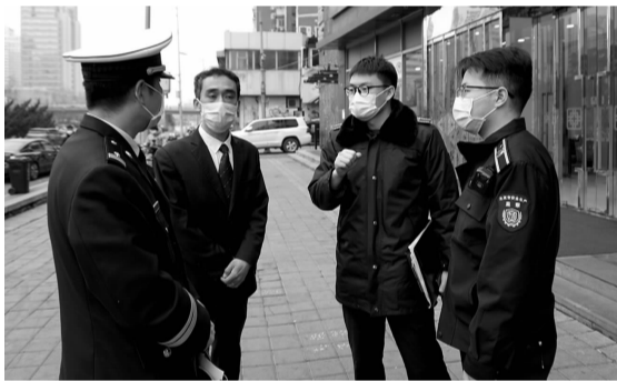
工作人员向商家讲解消防安全要点

按照消防安全安装防火门、电线裸露无防火材料、厨房油烟清洗不及时、安全出口数量不足等现象。“他们现在经营场所居住，已经涉嫌违法。店铺的装修使用了很多易燃易爆材料，如果发生火灾等安全问