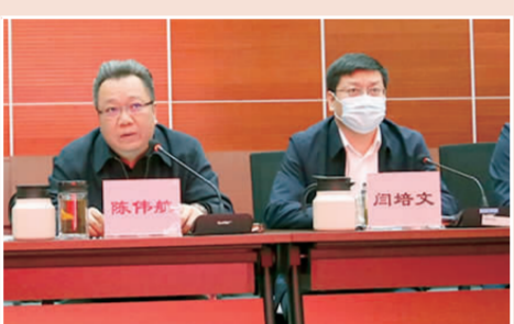
与会领导听取各科室工作汇报