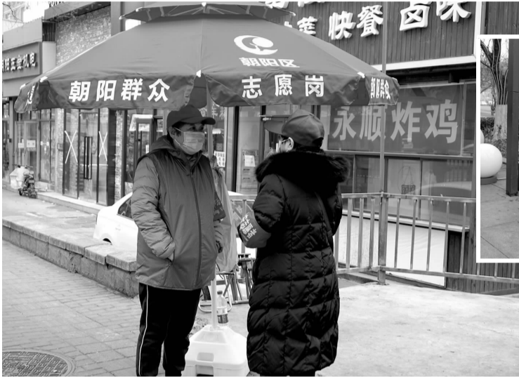
▲富力广场前，志愿者轮班上岗。